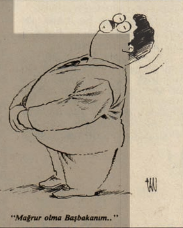
"Mağrur olma Başbakanım..."

Birçok mahkeme daha bitmemiş durumda ve bu mahkemelerde de çok sayıda idam cezası isteniyor. Sol Birlik, Türkiye ve Kuzey Kürdistan Kurtuluş Örgütü ve KUK-SE'nin açtığı "İdamlara, işkencelere ve Kürt halkı üzerindeki baskılara son" kampanyasına güç katmak, onu daha da yükseltmek en önemli güncel görevlerimizden biridir.